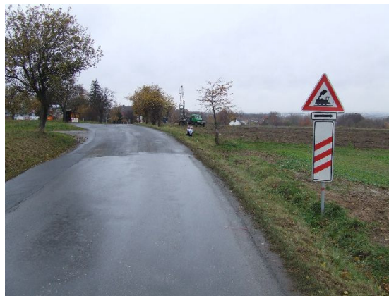
Obr. 2 Příjezd od Strančic ke křižovatce