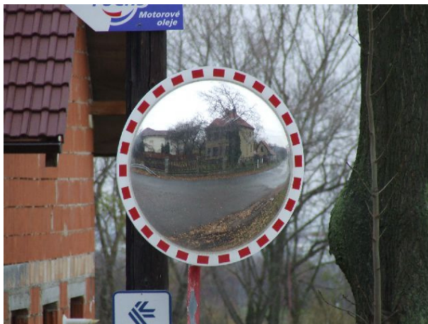
Obr. 6 Dopravní zrcadlo z pohledu řidiče