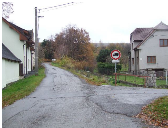
Obr. 9 Vjezd na místní komunikaci od návsi

Doporučení: Pro zajištění respektování zákazu průjezdu by bylo vhodné umístit na komunikaci zpomalovací příčný práh s příslušným dopravním značením. Majitelé přílehlých nemovitostí jsou podle předběžného jednání ochotni se na umístění prahu finančně podílet (K. Semerák, č.p. 42).