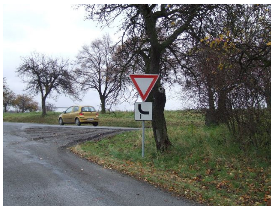
Obr. 1 Příjezd od Všechrom k silnici do Strančic

Návrh: přemístit dopravní značku mimo chodník, směrové tabule posunout na sloupek tak, aby nevyčnívaly nad chodník.