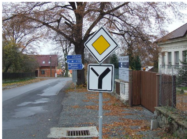
Obr. 5 Příjezd od Strančic a Velkých Popovic

Návrh: Přemístit dopravní značku se směrovou šipkou blíže ke křižovatce.