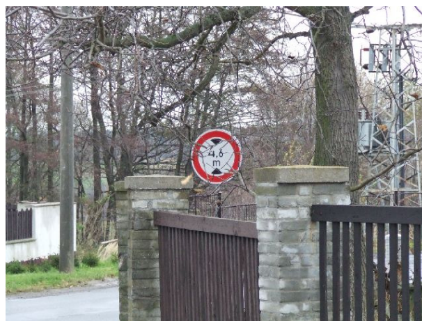
Obr. 7 Umístění značky B 16