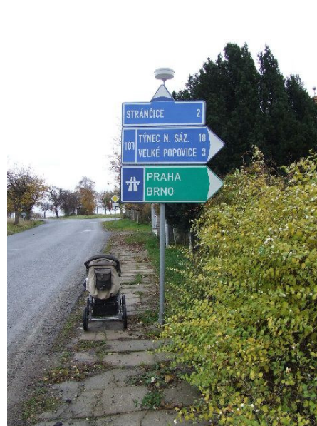
Obr. 4 Umístění směrových tabulí