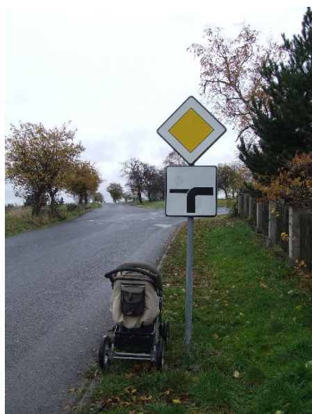
Obr. 3 Příjezd od Všechrom ke křižovatce