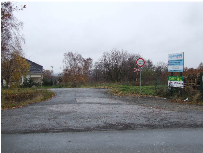
Obr. 8 Vjezd do obce od čerpací stanice

Návrh: Dopravní značku B 4 nahradit dopravní značkou B 32 – průjezd zakázán.